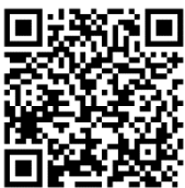
ระบบชำระเงินบำรุงการศึกษา