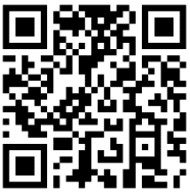
ระบบบันทึกประวัตินักเรียน